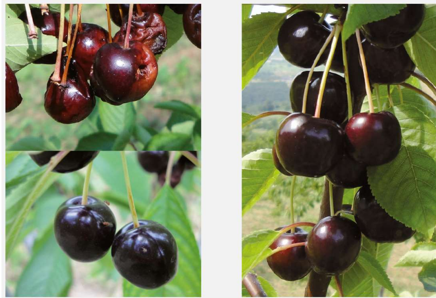
Kezeletlen és Exirel® rovarölő szerrel kezelt cseresznye

A Drosophila suzukii súlyosan károsíthatja a növényeket, jelentős gazdasági kárt eredményezve a cseresznye- és meggytermesztők számára. E kártevő irtására nem sok megoldás létezik. A Cyazypyr® hatóanyagú Exirel® SE rovarölő szer új hatásmechanizmust biztosít a Drosophila suzukii irtására (IRAC csoport: 28), így egy új, rendkívül hatékony növényvédelmi eszközt ad a termelők kezébe.